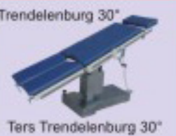
Ters Trendelenburg 30°