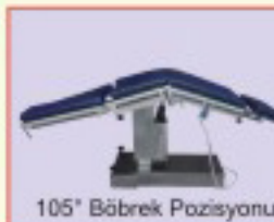
105° Böbrek Pozisyonu