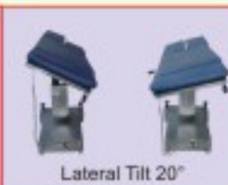
Lateral Tilt 20°