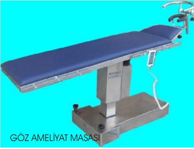
GÖZ AMELİYAT MASASI