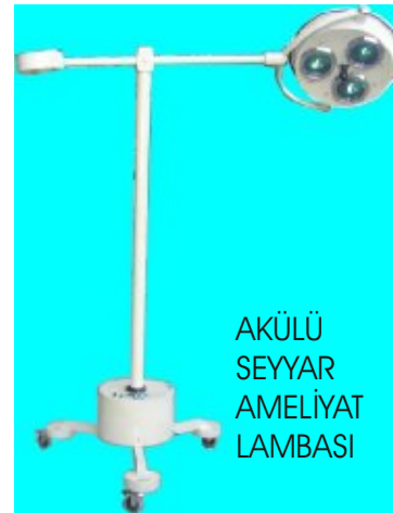
AKÜLÜ SEYYAR AMELİYAT LAMBASI