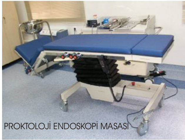
PROKTOLOJİ ENDOSKOPİ MASASI

TÜM VÜCUT AYNI ANDA SKOPI ALTINDA İNCELEME YAPILABİLİR